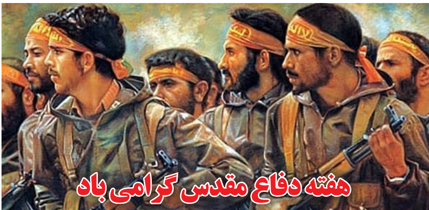
هفته دفاع مقدس گرامی باد